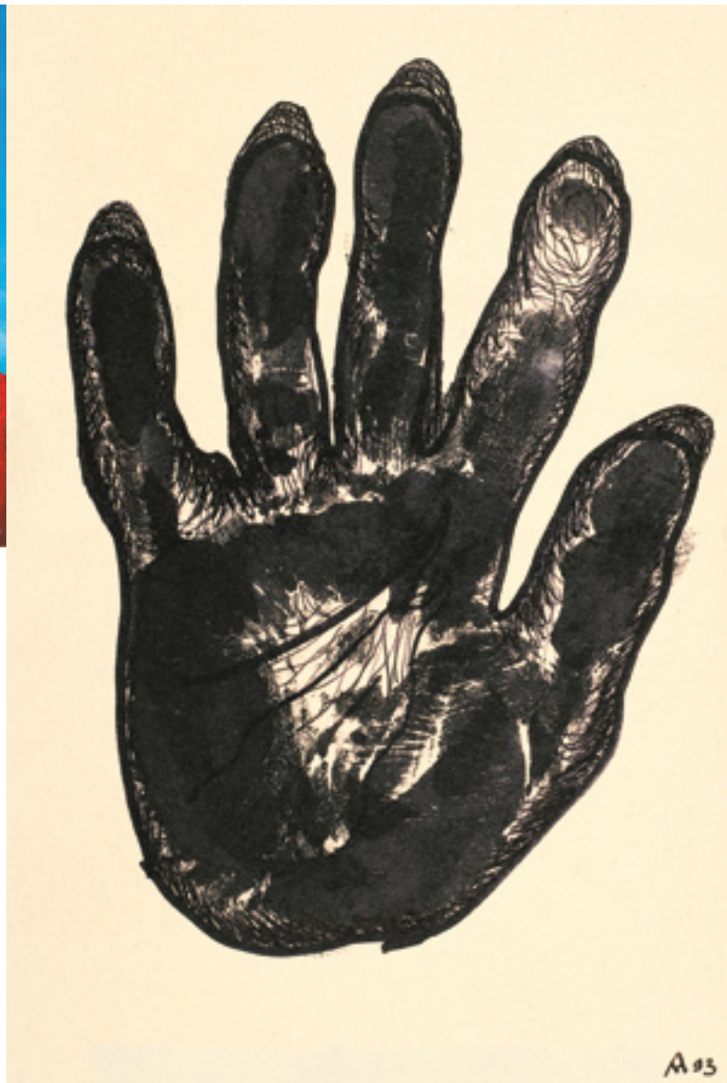
Magdalena Abakanowicz, Polonia

Il mondo è lo specchio dell'uomo. L'occhio è lo specchio del mondo e la finestra dell'anima. L'opera è confronto tra sé e il mondo. L'opera è l'autoritratto dell'artista. Il volto del mondo e quello dell'artista si sovrappongono. Ogni viso è un paesaggio. Un continente. Un mondo.